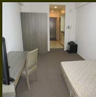
Al-b タイプ (22.44㎡)

1人暮らしに使いやすさと暮らしやすさの機能性を重視している標準の1Kタイプが人気です。各お部屋には、ベッドやテレビ、デスク、エアコン、照明、洗濯機、なども備え付けられています。