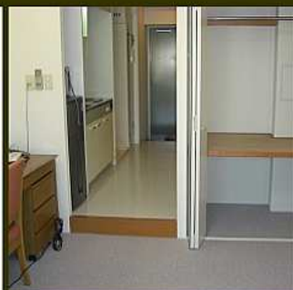
Al-a タイプ (22.39㎡)